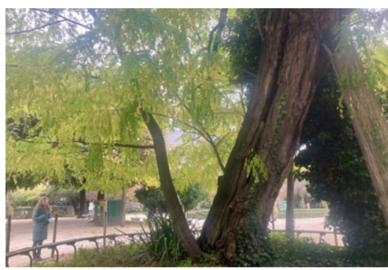
Beim ältesten Baum von Paris

Wir werden im malerischen Jardin de Luxembourg 20 Statuen von Frauen, die in Paris und Frankreich bisher eine große Rolle gespielt haben, spielerisch wandelnd kennenlernen.